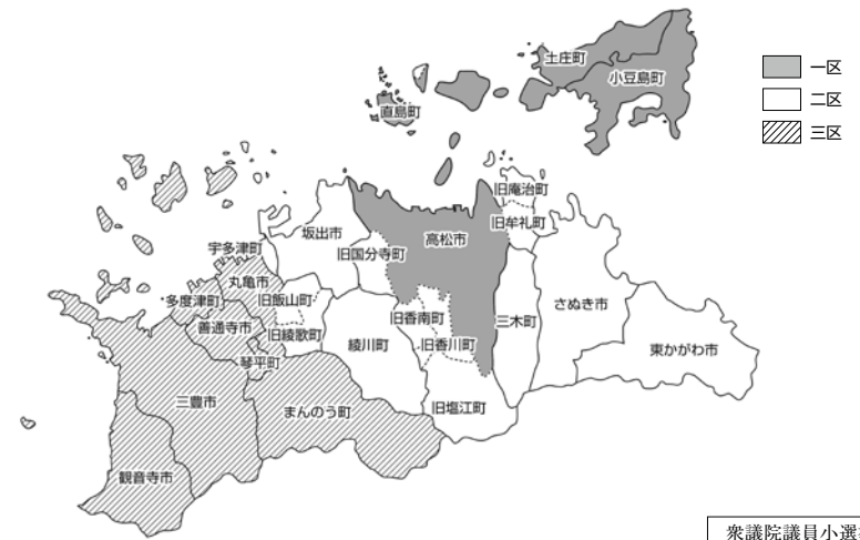
衆議院議員小選挙区図