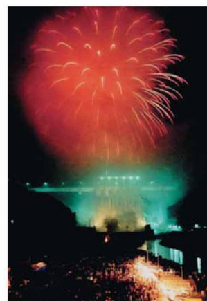
ダム直下ふれあい広場では、毎年8月第1土・日曜日に「やまびこカーニバル」が開催され、大勢の人で賑わう。

四国のまん中、吉野川の源流域にある土佐町は、四国の水がめ早明浦ダムを有し、美しい棚田が広がる豊かな自然に囲まれた町。古くから良質の米づくりで知られ、土佐の三大米どころのひとつ相川米の産地でもある。早明浦ダムの上流の瀬戸川渓谷は、アメガエリの滝の迫力とともに、その上流に向けては紅葉シーズンには格段に美しさが増す。