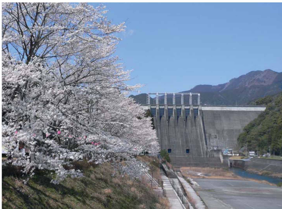
早明浦ダムは日本有数の貯水量を誇る多目的ダムで、春には2,000本もの桜が咲き誇る。