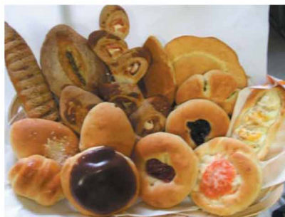
食パンや菓子パンなど100種を超える品揃え。