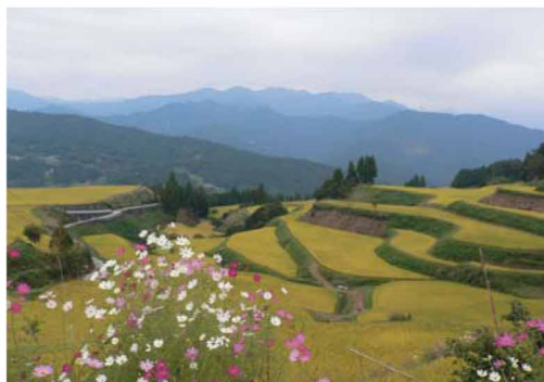
町内では、美しい棚田風景をあちこちで見ることができ、田植えや収穫のシーズンには県内外の写真愛好家が多数訪れる。