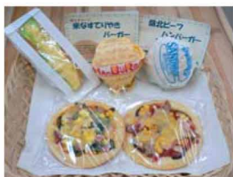
米粉パンと地域食材を組み合わせたご当地バーガーも人気。