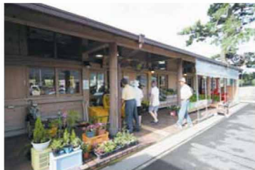
赤いノボリが目印。地元産の野菜、朝どれの鮮魚や芸西村の特産品かっぱバーガーや黒糖入りピーマン味噌も販売!

波が引いてゆく時、砂が転がり海水の中に妙な音が聞こえることや砂丘の形状がふくれた琴の胴にもみえることから古きころより「琴ヶ浜」と呼ばれ人々に親しまれてきた美しい海浜。東西に約6キロメートルにおよぶ松林の中を抜けるようにサイクリングロードが整備されており、潮風とともに走るシーサイドサイクリングが人気の観光スポットだ。美しい景観を利用した「観月の宴」など多くのイベントが開催される。周辺には海水を利用した「海水健康プール芸西」や「琴ヶ浜松原野外劇場」「地場産品直販所「かっぱ市」」があり来場客で賑わいをみせている。