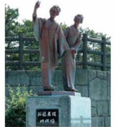
坂本龍馬の妻お龍は、龍馬の死後、妹の嫁ぎ先である芸西村に1年ほど滞在していた。そのことを記念して建てられた姉妹像は、桂浜の龍馬像に手を振っているようにも見える。

2011年1月ドイツで開催された世界47カ国15000の出展者で開催される世界最大級の国際園芸見本市「IPM ESSEN 2011」で切り花部門最優秀賞を受賞した芸西村のブルースター「ピュアブルー」。 平成18年にブランド化したオリジナル品種であり鮮やかなブルーの花びらが星のように咲くのが特徴的。芸西村は全国シェア9割を占める一大産地である。花言葉は「信じあう心」。ブライダル業界では大人気の花である。