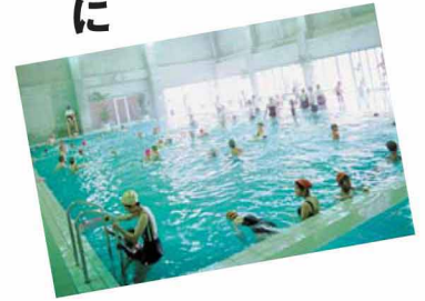
海水プール芸西／目前に広がる美しい琴ヶ浜を眺めながら、海水が持つ天然の成分を利用したタラソテラピーで「こころ」も「からだ」も癒される。