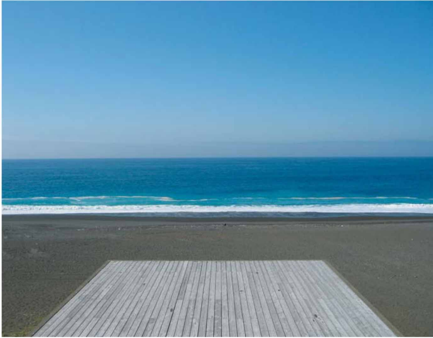
琴ヶ浜松原野外劇場