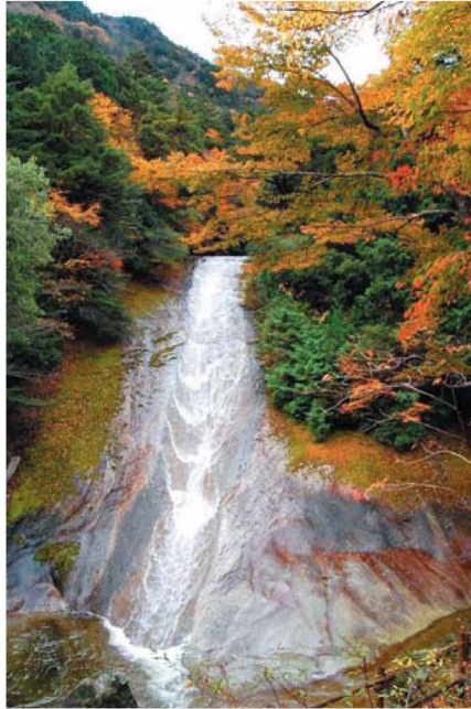
日本の滝百選「雪輪の滝」。滑床溪谷のシンボリック的存在。全長300mの一枚岩の上をさらさらと雪の輪を描くように溪流が流れ落ちる。