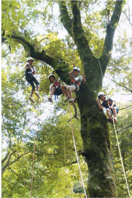
「この森に学びこの森に遊びて あめつちの心に近づかむ」 この子らに残したい大自然の恵み。