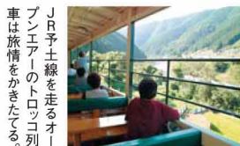
JR予土線を走るオープンエアのトロリー列車は旅情をかきたてる。

日本最後の清流「四万十川」。この滔滔たる流れの最初の一滴が始まる場所のひとつに「滑床溪谷」があります。美しい渓谷美、豊かな森林美、時間を忘れるほどの展望美が評され「国立公園」にも指定されている。滑床溪谷は、遊びと学びの宝庫。四季折々の美しさが楽しめる渓谷散策をはじめ、アカシヨウビンやカワセミなどの100種類以上の鳥たちのパードウオッチング、アメゴの溪流釣り、溪谷をまさに体験できる滝すべりやキャニオニング、木登りやキャンプなど、自分なりの滑床溪谷を存分に楽しんでください。