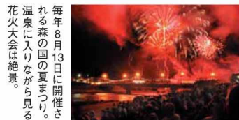
毎年8月13日に開催される森の国の夏まつり。温泉に入りながら見る花火大会は絶景。