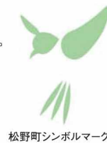
松野町シンボルマーク

走ること暫し松丸駅には「森の国ボツボ温泉」があり、町内の造り酒屋の大きな酒樽を使った露天風呂や滑床溪谷をイメージした岩風呂、無料の足湯などが楽しめる癒しのスポットとなっている。ちなみにこの露天風呂の酒樽で作られていた酒の銘柄は「伊予美人」。癒しと美貌を手に入れる効能がある温泉かも。