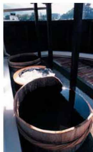
清酒「伊予美人」の仕込み樽を利用した「森の国ぼっぼ温泉」の露天風呂。このお風呂に入ると美人になれる。