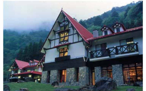
滑床溪谷にある「森の国ホテル」。赤い大屋根と白い漆喰の壁が周囲の緑と絶妙のコントラストを見せる。上質なおもてなしと料理が評判のホテル。