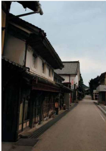
伊予と土佐の交易の要衝として栄えた面影を残す旧松丸街道。森の国ぼっぼ温泉は、この街道に位置するJR松丸駅にある温泉。